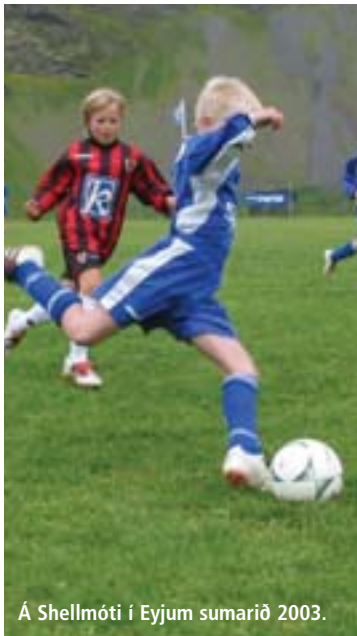
Á Shellmóti í Eyjum sumarið 2003.