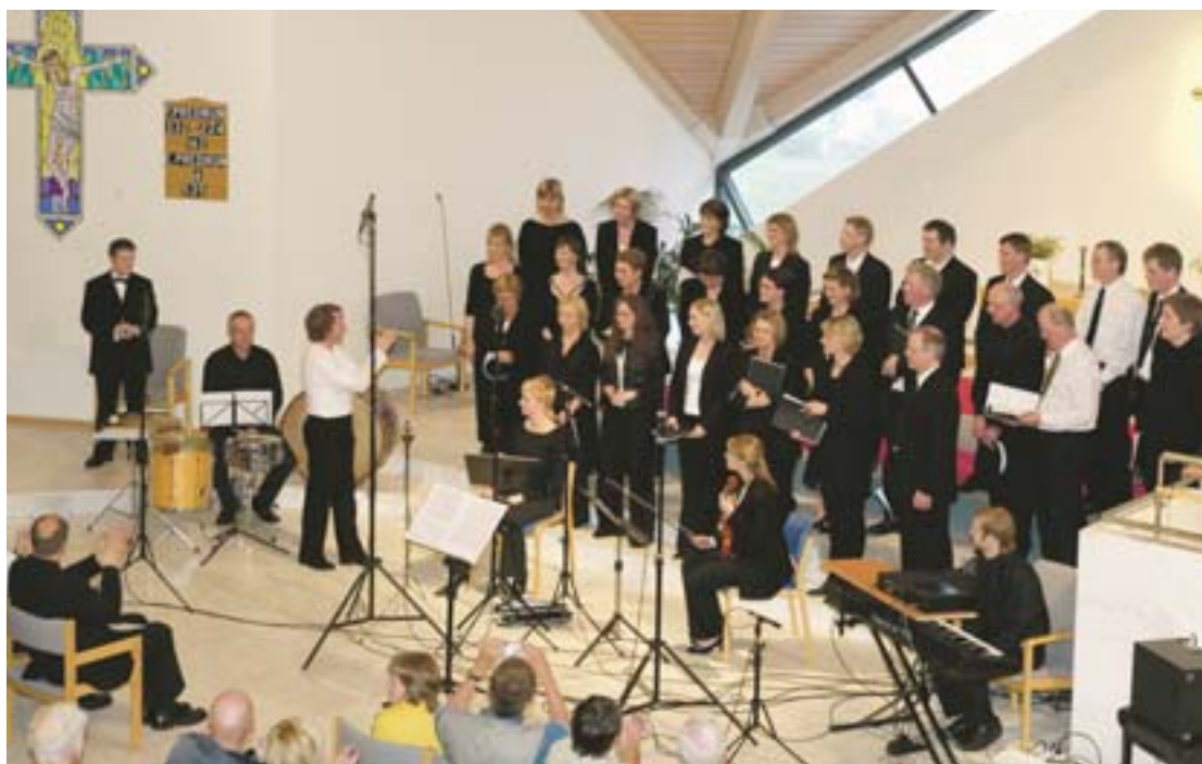
Frá tónleikunum í Seltjarnarkirkju.

„Það færir sem betur fer í vöxt að fyrirtæki leggi fjármuni í menningarstarfsemi og líti á slíkt sem mikilvægan hluta af ímynd sinni inn á við og út á við. Við göngum til samninga við þessi fyrirtæki fullviss um að það sé þeim hagstætt að stofna til samstarfs við Íslensku óperuna,“ segir óperustjóri enn fremur.