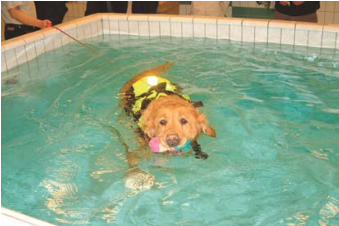
Golden Retriever hundur fær sjúkraþjálfun eftir bílslys í endurhæfingarstöð AGRIA í Svíþjóð.