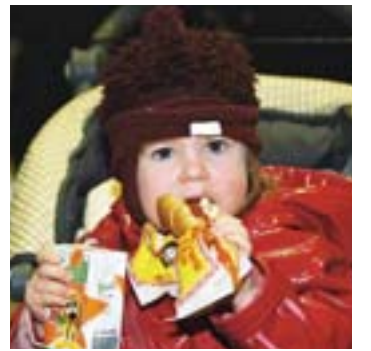
Fólk, líf og fjör á fjölskylduhátíð VÍS í Viðidal.